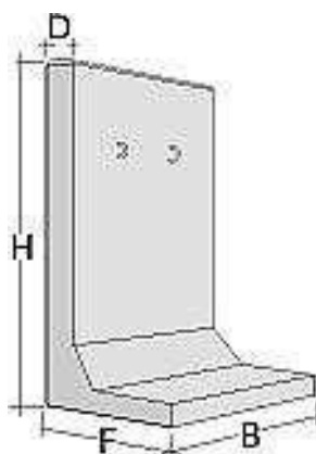
Rys. 1. Przykład żelbetowego wspornika kąтового do wykonywania murów oporowych